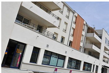
La MDPH de la Meuse