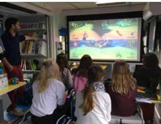
Une équipe de collégiens à la manette.

L'Atelier est avant tout un espace ouvert et convivial, dédié à l'échange des savoirs, où chacun peut amener ses connaissances et les partager. Afin de s'initier à de nouvelles pratiques numériques, artistiques, techniques et scientifiques, des ateliers ludiques y sont proposés. Cette année, près de 88 ateliers seront menés sur les 15 communautés de communes de la Meuse. L'équipe de la Bibliothèque départementale proposera notamment des modules d'apprentissage au numérique et des actions d'éducation aux médias. Se déplaçant au plus proche des publics, l'Atelier participe à réduire la fracture numérique dans nos territoires.