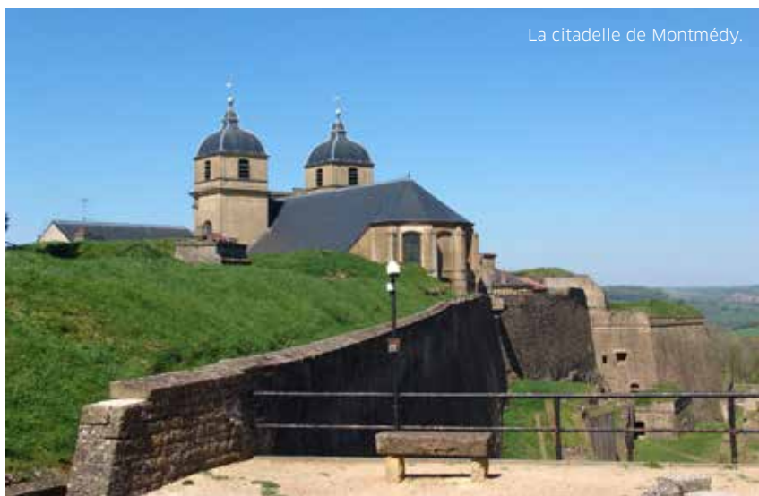
La citadelle de Montmédy.

Une étude d'accompagnement stratégique du Département est en cours sur le projet de valorisation touristique du territoire de Montmédy, en s'appuyant sur la Citadelle.