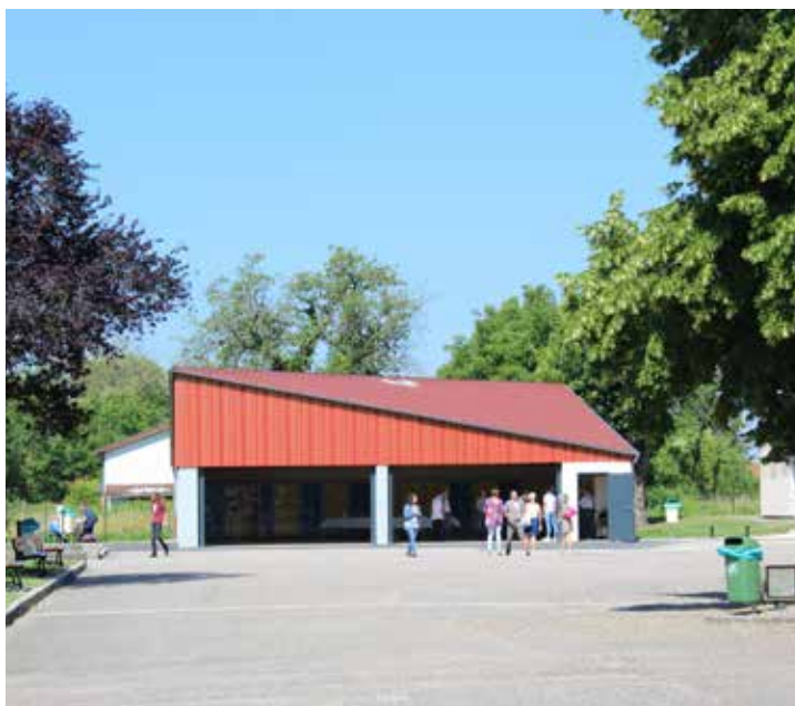
Collège Jean Moulin de Revigny : Construction d'un nouveau préau.

L e montant investi au profit des collèges meusiens par le Département en 2018 est de 3,62 millions d'euros, soit une augmentation de 90,5 % par rapport à l'année 2017 (1,9 million d'euros). Cet effort a pour vocation de se poursuivre dans les années à venir. Pour l'exercice 2019, les prévisions sont en effet en progression de 36,6 %, par rapport à 2018, avec un investissement total escompté de 4,95 millions d'euros. Dans un contexte financier contraint par la baisse des dotations de l'État, le Département de la Meuse réaffirme ainsi fermement son soutien à l'enseignement sur l'ensemble de son territoire. Cette politique volontariste illustre son engagement pour garantir des équipements et des infrastructures performants afin d'offrir des conditions d'apprentissage et de travail propres à la réussite de tous les collégiens.