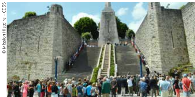
Cérémonie au monument à la Victoire de Verdun.

Bon à savoir : tarif spécial le samedi et le dimanche aux forts de Vaux et Douaumont.