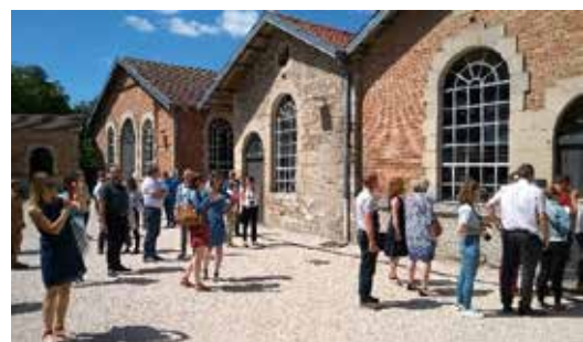
Le site d'Écurey, reconverti grâce au dynamisme des acteurs du territoire.

preneurs d'entreprises en recherche de financement. Son rôle : faciliter l'accès au crédit bancaire et apporter des solutions de financement (prêts, garantie de prêts, primes, investissement en fonds propres). Lorraine Active s'investit aussi aux côtés des dirigeants d'associations ou d'entreprises solidaires. En finançant la création, le développement ou la consolidation de ces structures, elle participe à pérenniser et favoriser les services de proximité. Elle mène enfin des actions en direction de publics spécifiques (femmes, habitants des Quartiers Prioritaires de la Ville, jeunes) en coopération avec d'autres acteurs et participe à des manifestations de promotion sur des thématiques comme l'entrepreneuriat engagé ou encore l'innovation territoriale.