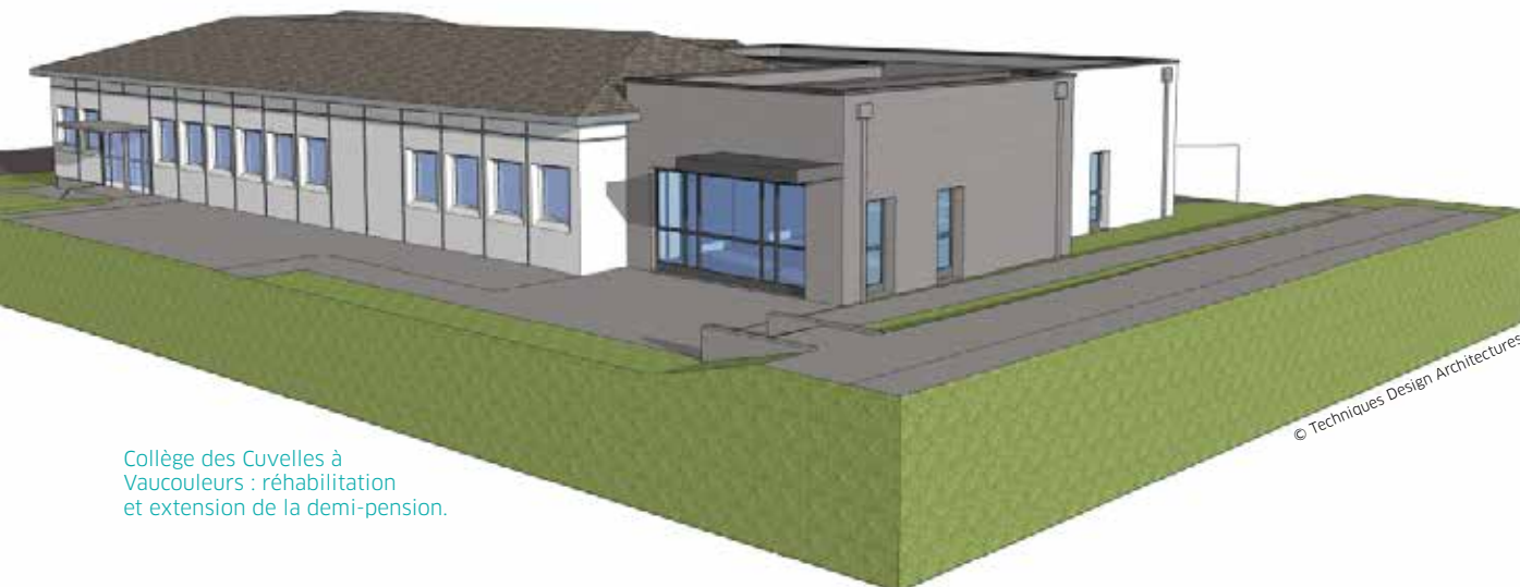
Collège des Cuvelles à Vaucouleurs : réhabilitation et extension de la demi-pension.

Curie de Boulogny. Le Conseil départemental de la Meuse s'engage notamment à associer, le moment venu, la communauté éducative à toutes les étapes clés des projets immobiliers prévus.