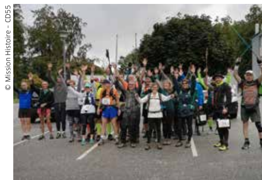
Départ des marcheurs de la « Route des Hommes ».