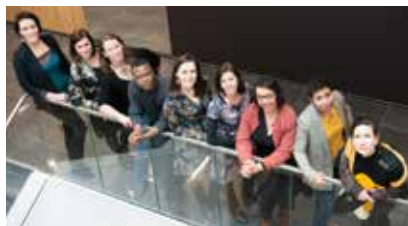
Une équipe au service des initiatives créatrices d'emplois.

L orraine Active s'illustre sur le champ de l'Économie Sociale et Solidaire depuis maintenant quinze ans, et participe au développement économique des territoires en facilitant la mise en œuvre de projets de création et de consolidation d'emplois durables et non délocalisables. Basée à Nancy, l'association intervient sur toute la Lorraine auprès des créateurs ou