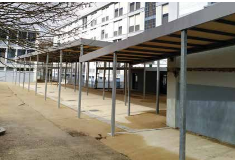
Collège Robert Aubry de Ligny-en-Barrois : reconstruction d'une galerie couverte.