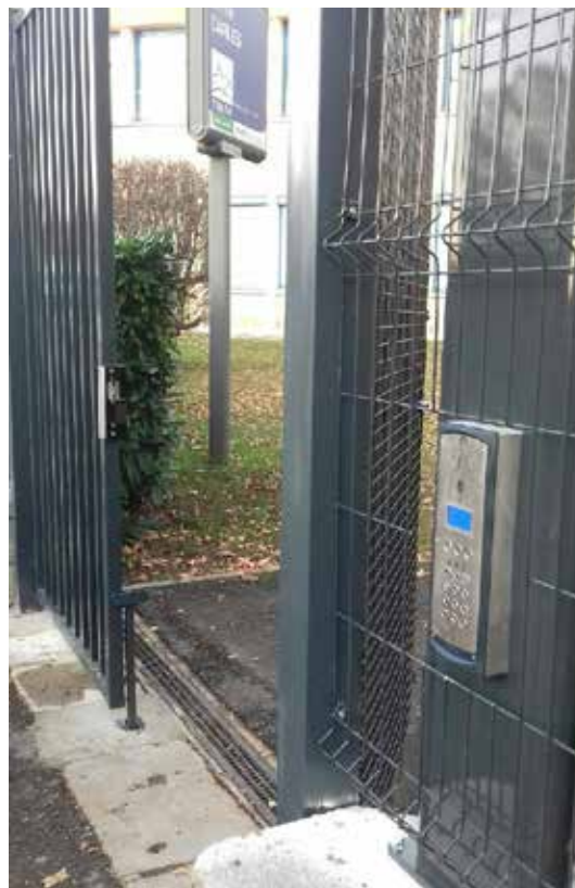
Collège Émilie Carles d'Ancerville : contrôle d'accès.