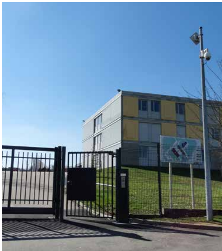
Collège Les Avrils de Saint-Mihiel : contrôle d'accès.