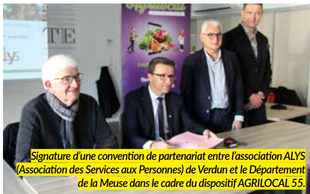
Signature d'une convention de partenariat entre l'association ALYS (Association des Services aux Personnes) de Verdun et le Département de la Meuse dans le cadre du dispositif AGRILocal 55.