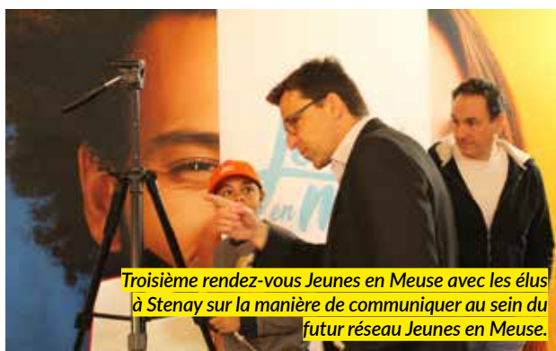
Troisième rendez-vous Jeunes en Meuse avec les élus à Stenay sur la manière de communiquer au sein du futur réseau Jeunes en Meuse.