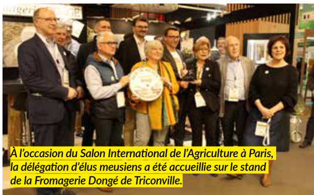
À l'occasion du Salon International de l'Agriculture à Paris, la délégation d'élus meusiens a été accueillie sur le stand de la Fromagerie Dongé de Triconville.