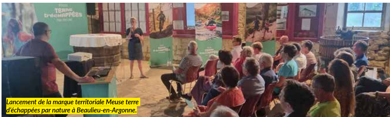
Lancement de la marque territoriale Meuse terre d'échappées par nature à Beaulieu-en-Argonne.