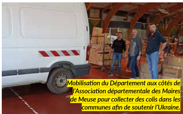
Mobilisation du Département aux côtés de l'Association départementale des Maires de Meuse pour collecter des colis dans les communes afin de soutenir l'Ukraine.