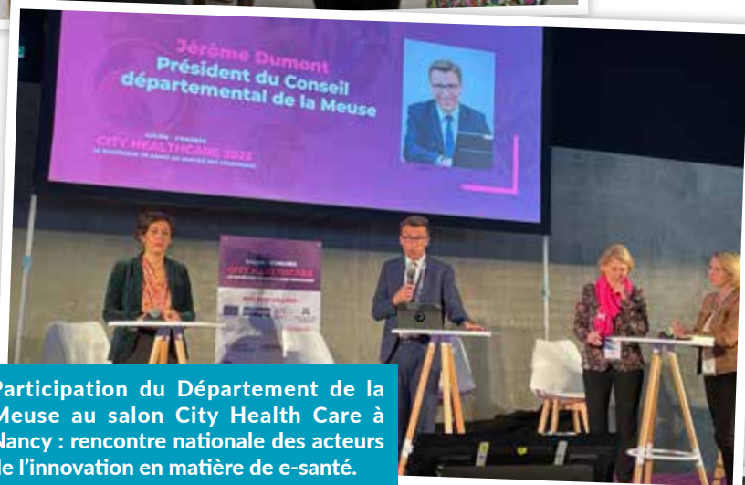
Participation du Département de la Meuse au salon City Health Care à Nancy : rencontre nationale des acteurs de l'innovation en matière de e-santé.