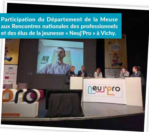
Participation du Département de la Meuse aux Rencontres nationales des professionnels et des élus de la jeunesse « Neu'Pro » à Vichy.