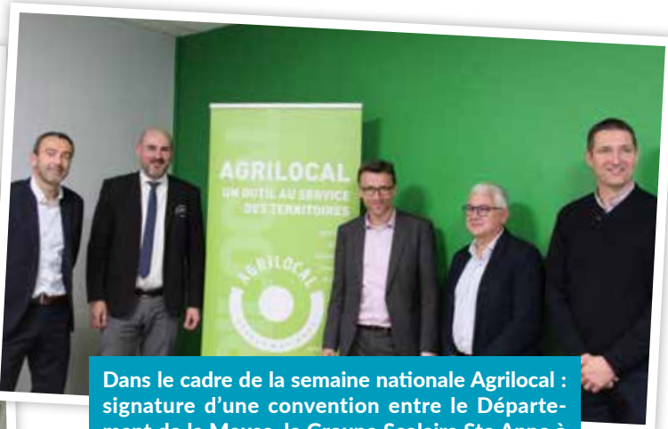
Dans le cadre de la semaine nationale Agrilocal : signature d'une convention entre le Département de la Meuse, le Groupe Scolaire Ste Anne à VERDUN et la société « Mille et un repas de l'Est ».