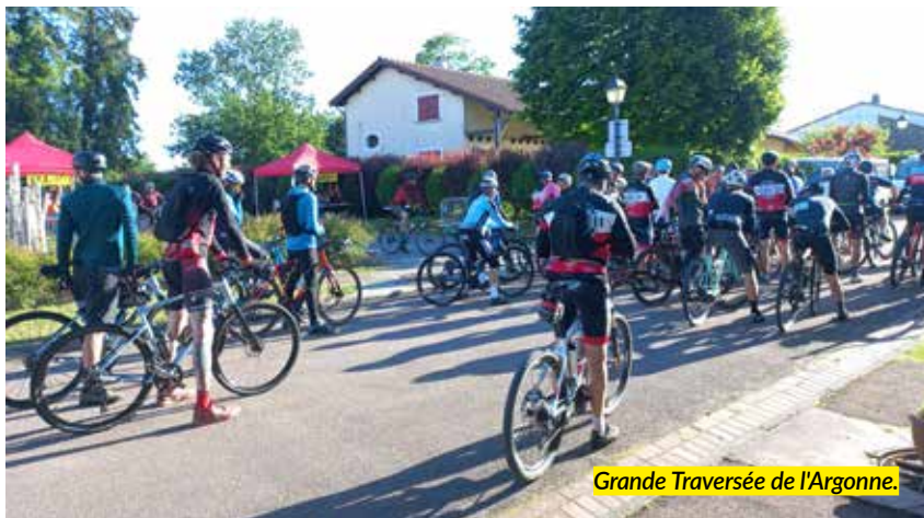
Grande Traversée de l'Argonne.

Ce sont plus de 7 000 participants qui se sont retrouvés pour partager leur goût