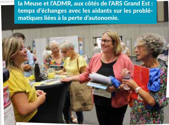
1 er Forum des aidants porté par le Département de la Meuse et l'ADMR, aux côtés de l'ARS Grand Est : temps d'échanges avec les aidants sur les problématiques liées à la perte d'autonomie.