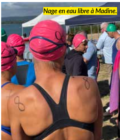
Nage en eau libre à Madine.