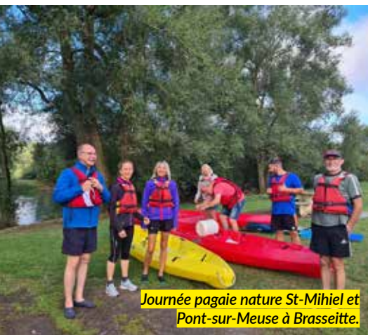
Journée pagaie nature St-Mihiel et Pont-sur-Meuse à Brasselette.