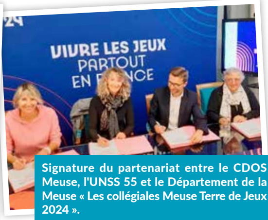
Signature du partenariat entre le CDOS Meuse, l'UNSS 55 et le Département de la Meuse « Les collégiales Meuse Terre de Jeux 2024 ».