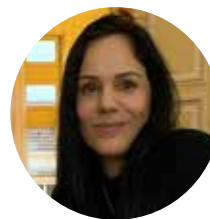
REDPALN, illustratrice indépendante et passionnée d'histoire.